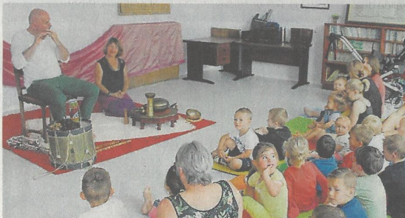
Les enfants de l'école et du Relai assistants maternels d'Aure, ont assisté à un spectacle musical, Le petit chasseur de bruits .