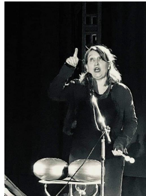
Clarissa Pinkola Estré

Le récit doit vivre en nous avant de se montrer, se raconter. C'est l'histoire qui décide, alors il nous faut parcourir les images, les sensations qui naissent avec